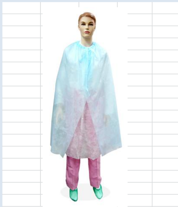
Накидка для посетителя