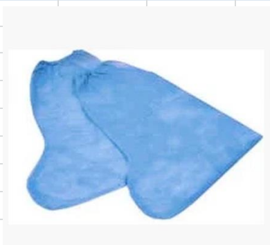
Бахилы высокие на резинке

Ткань : спанбонд Стерильность : нестерильный Размер : универсальный