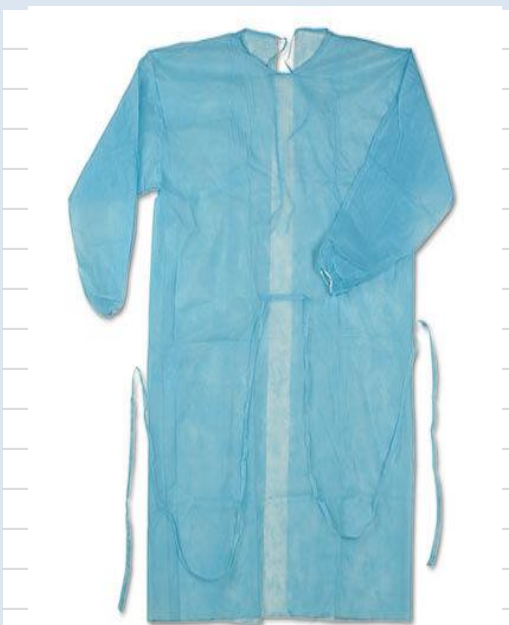
Халат хирургический на завязках