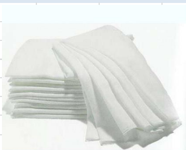
Марлевые отрезки индивидуально упакованы Размеры 1 м, 1.5м, 2м, 3м, 5м, 10 м ТУ 9393-001-10715071-2014 Плотность 28,30