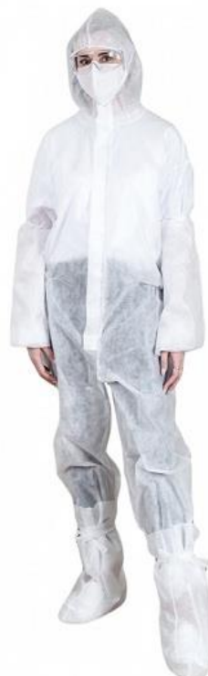
Комплект: комбenezон защитный с высокими бахилами на резинке

Стерильность : нестерильный Размер : универсальный