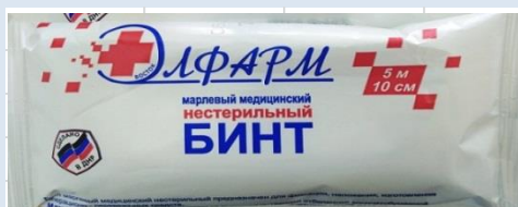
Бинт нестерильный в индивидуальной упаковке Размер 5 см на 10 см ТУ 9393-005-10715071-2014 Плотность 30