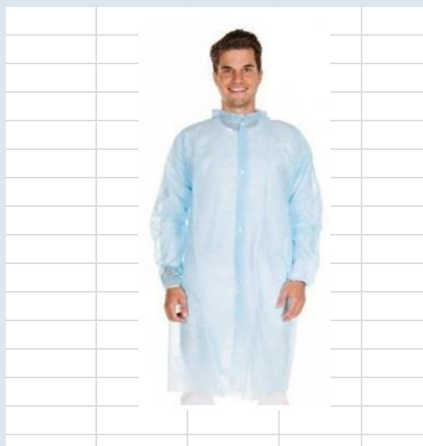
Халат одноразовый нестерильный