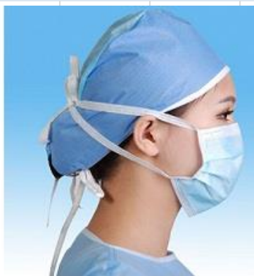
Маска медицинская 3-х слойная на завязках ТУ 32.50.50-002-00302178-2020 Ткань: спанбонд