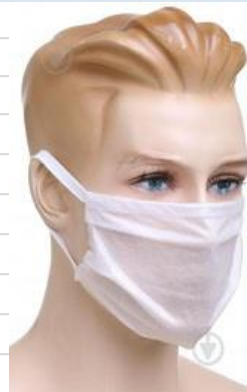
Маска медицинская 3-х слойная на резинках ТУ 32.50.50-002-00302178-2020 Ткань: спанбонд