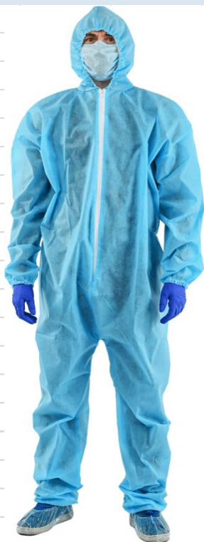
Комбenezон защитный на молнии