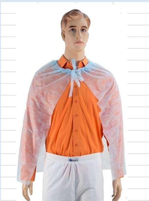
Накидка для посетителя