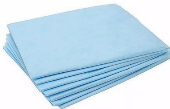
Простынь одноразовая 200*80 голубая

Стерильность : нестерильный Размер : универсальный Плотность : 25