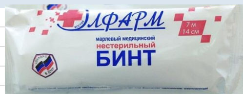
Бинт нестерильный в индивидуальной упаковке Размер 7 см на 14 см ТУ 9393-005-10715071-2014 Плотность 30