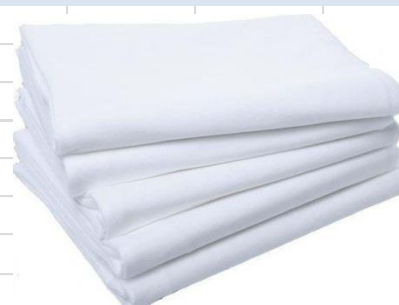
Марлевые отрезки индивидуально упакованы Размеры 1 м, 1.5м, 2м, 3м, 5м, 10 м ГОСТ 9412-93 Плотность 36